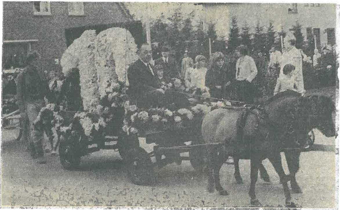
Mit einem bunten Umzug wird das Brunnenprinzenpaar zum Brunnen und zurück gebracht. Mehrere Ponygespanne bildeten den Umzug. Die Brunnengemeinschaft feierte ihr zehntes Brunnenfest.