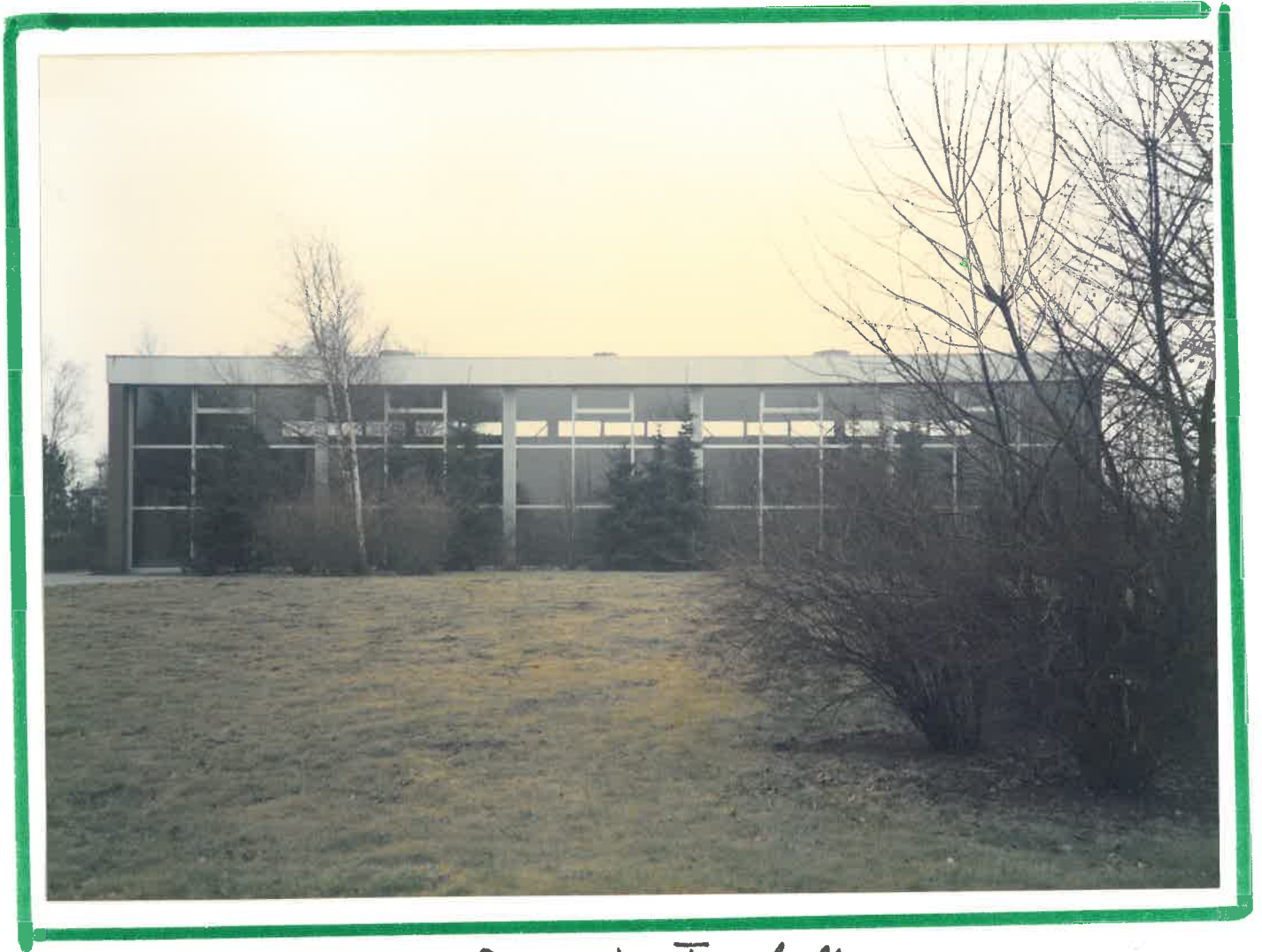
Die neue Turnhalle