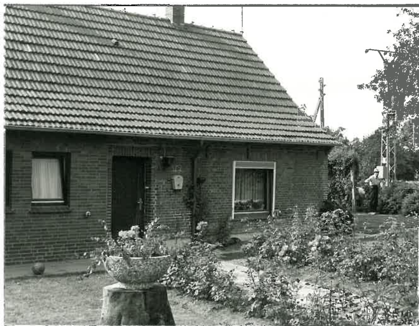
Die alte Post

Abschlußball im Festzelt (freier Eintritt).