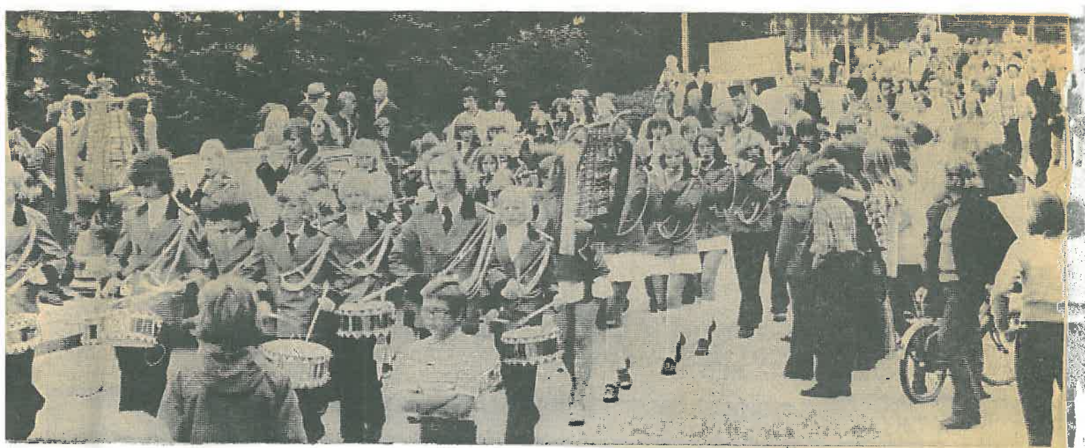
Viel Trubel herrschte trotz nicht ganz so guten Wetters zum Brunnenfest in Grafschafts Straßen.