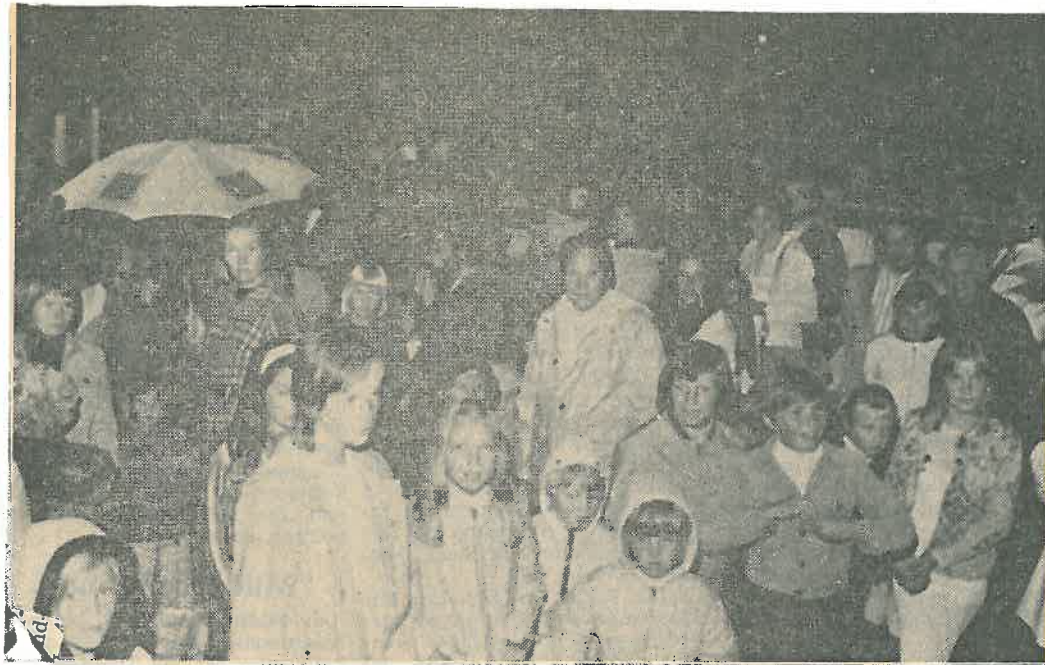
Trotz Regenschauer wurde am Freitagabend der Laternenumzug veranstaltet. Auf dem Platz am Brunnen trafen sich die jungen Grafschäfter.