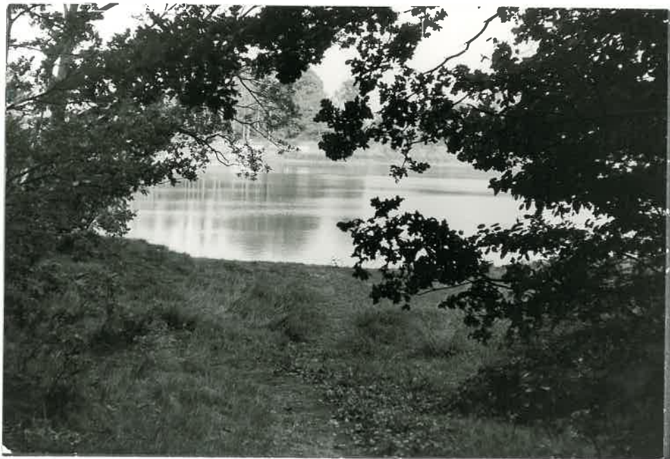
Die Barkler Sandkuhle