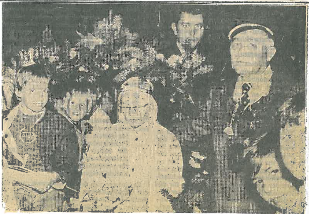
Bild links: Andrang beim Freibier! Ob auch die Jugend etwas abbekam?