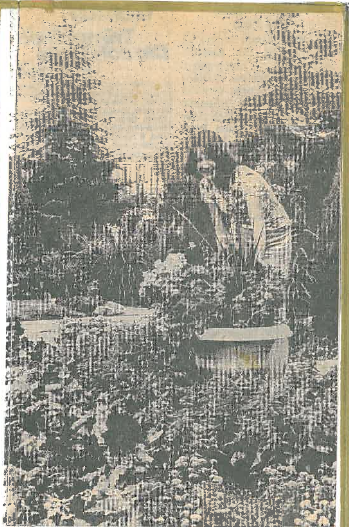
Gärten, liebevoll gepflegt, sind dominierend für Grafschaft