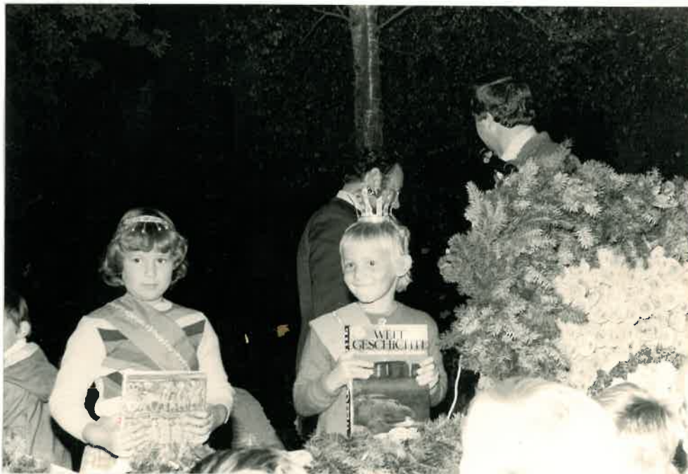
Schon ist es dunkel. Gleich geht der Laternenumzug los !