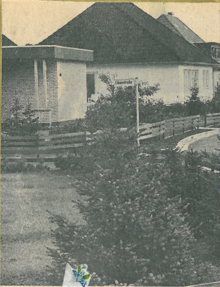
Schöne Vorgärten in ...rsumer Straße in Höhe der Elbenstraße.