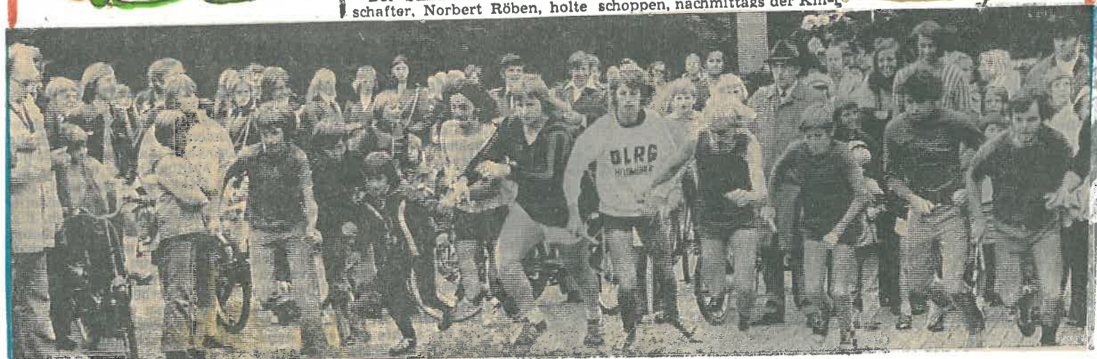
Start zum Staffellauf „Rund um Grafschaft“, 66 Läufer waren dabei.