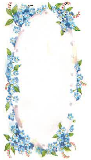
Erinnerungen für's Leben