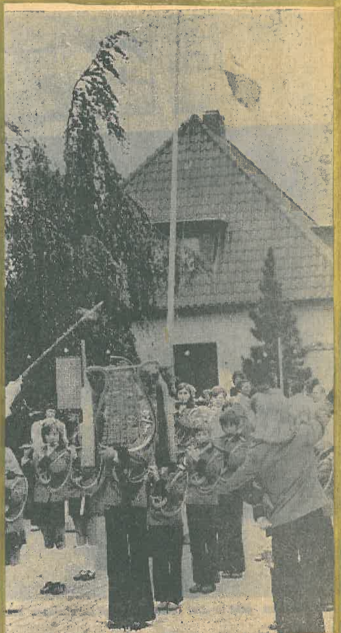
Vor der Grafschafter Flagge, die im Wind „peitschte“, spielen die Spieler des Spielmannszug Sillenstede auf.