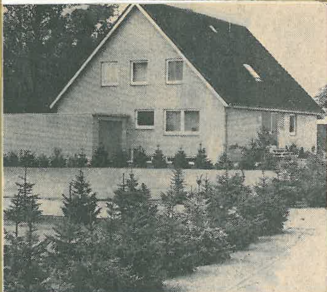
Viele Straßen tragen dem gärtnerischen Charakter Grafschafts entsprechend Namen von Blumen. Hier der Krokusweg.