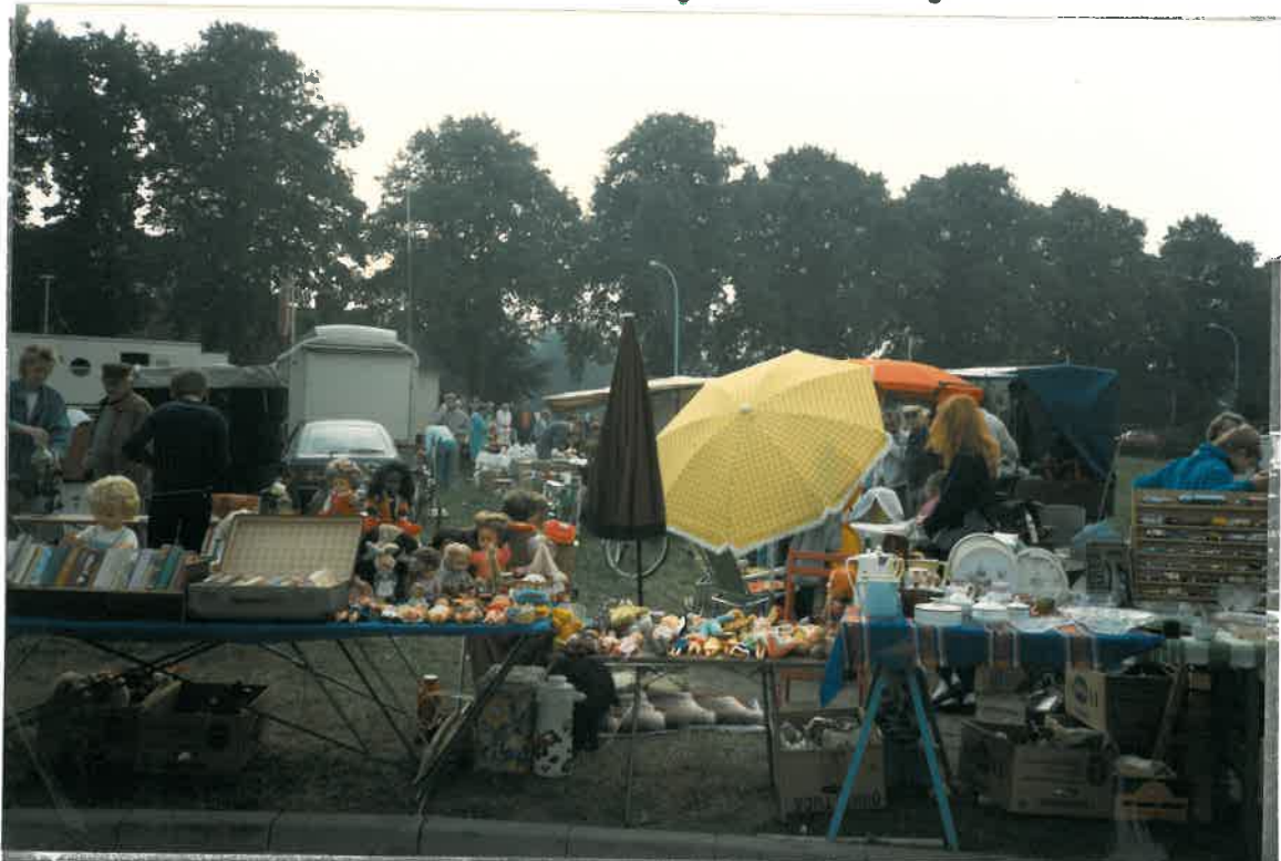
Kleine und große Händler waren mit den Umsätzen beim Flohmarkt zufrieden.