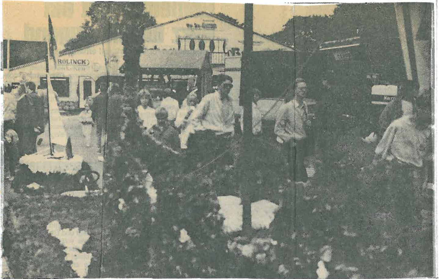
Der neue Festplatz an der Sillensteder Straße erwies sich für das Grafschafter Brunnenfest als ideal.