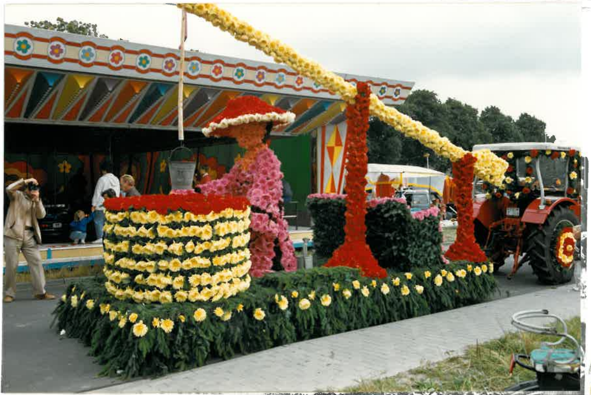
Madame an der Pitt (Moortannen)