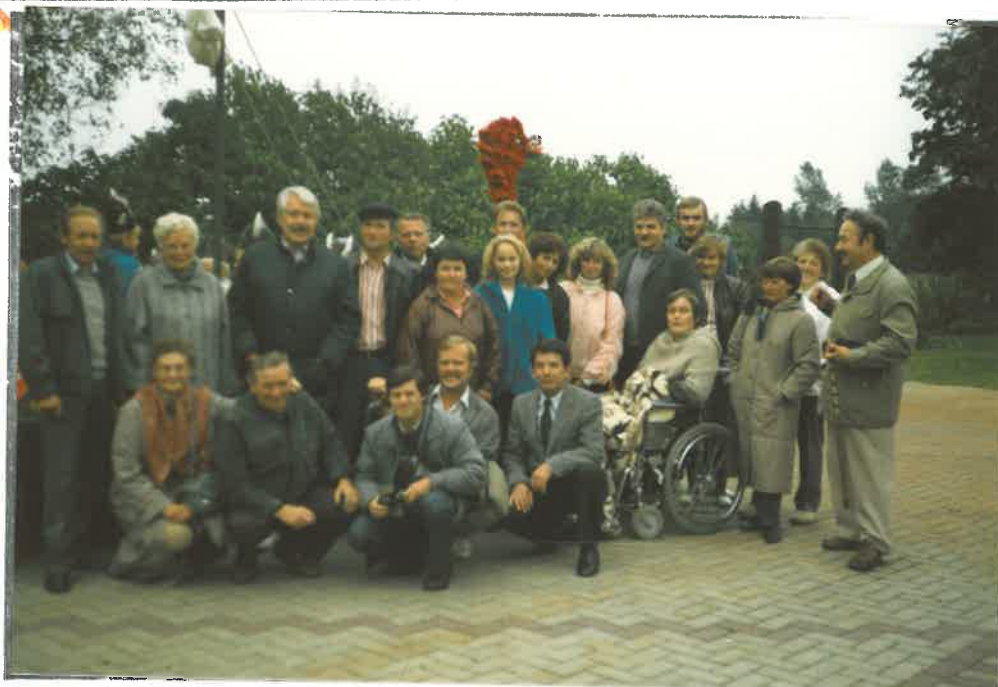
Die Tüftner 1986