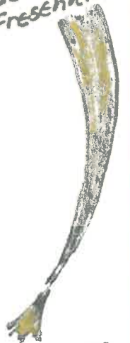
Jorfkarre der Ponygruppe