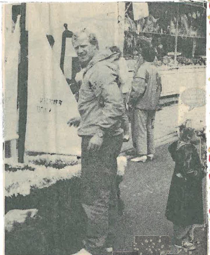
Kurz vor dem großen Umzug wurde von dem Erbauer letzte Hand am „Blumenschiff“ angelegt.