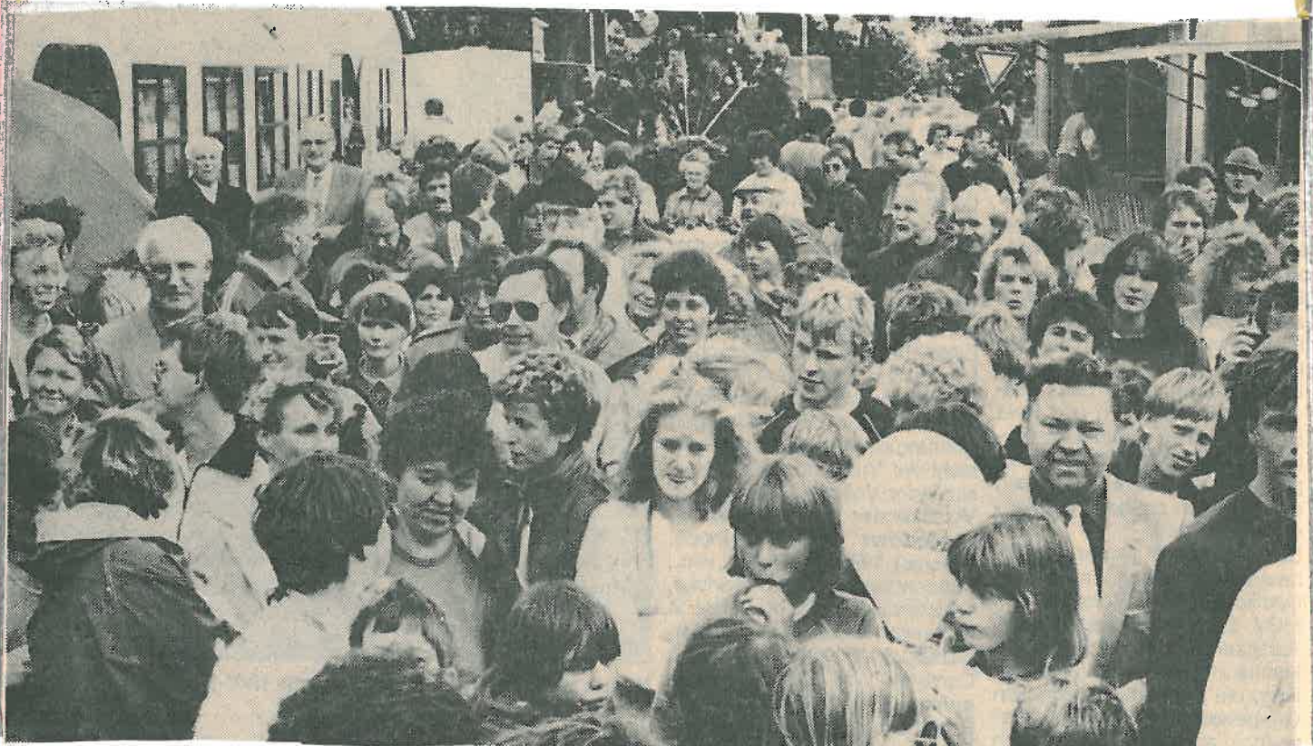
Zeitweise gab es auf dem neuen Festplatz an der Sillensteder Straße kein Durchkommen.