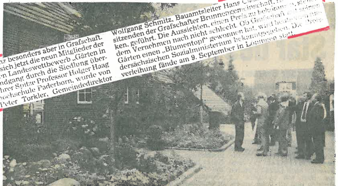
Einen guten Eindruck von Grafschaft nahm die Bewertungskommission mit nach Hannover.