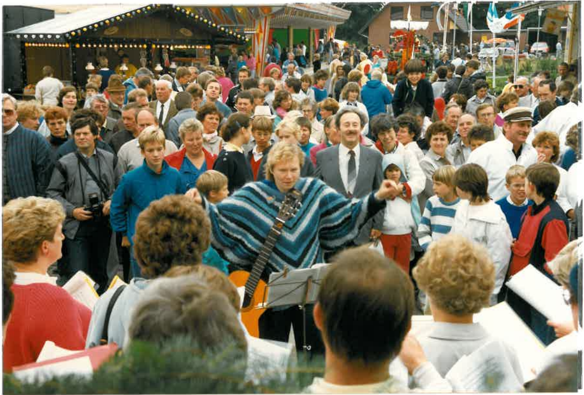
Die noch junge Singgemeinschaft Grafschaft gab beim 26. Brunnenfest eine erste Probe ihres Könnens.