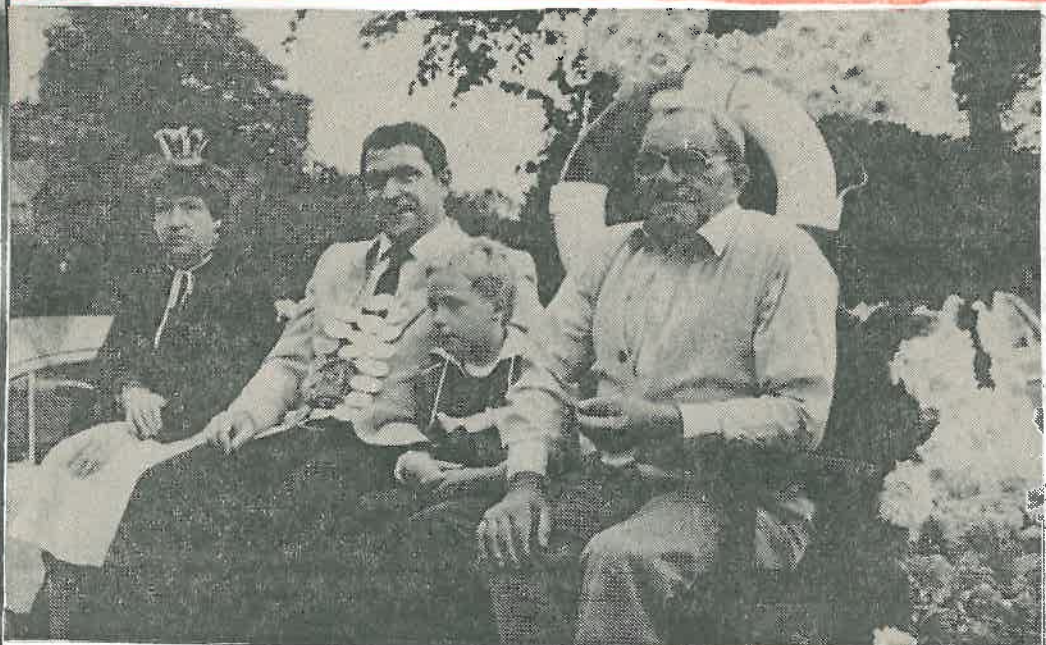
Jedes Jahr wird in Grafschaft ein neuer Brunnenmeister gewählt, so will es die Tradition. Er muß eine Menge Reiselust aufbringen, denn drei Umzüge stehen in diesem Jahr wieder auf dem Programm.