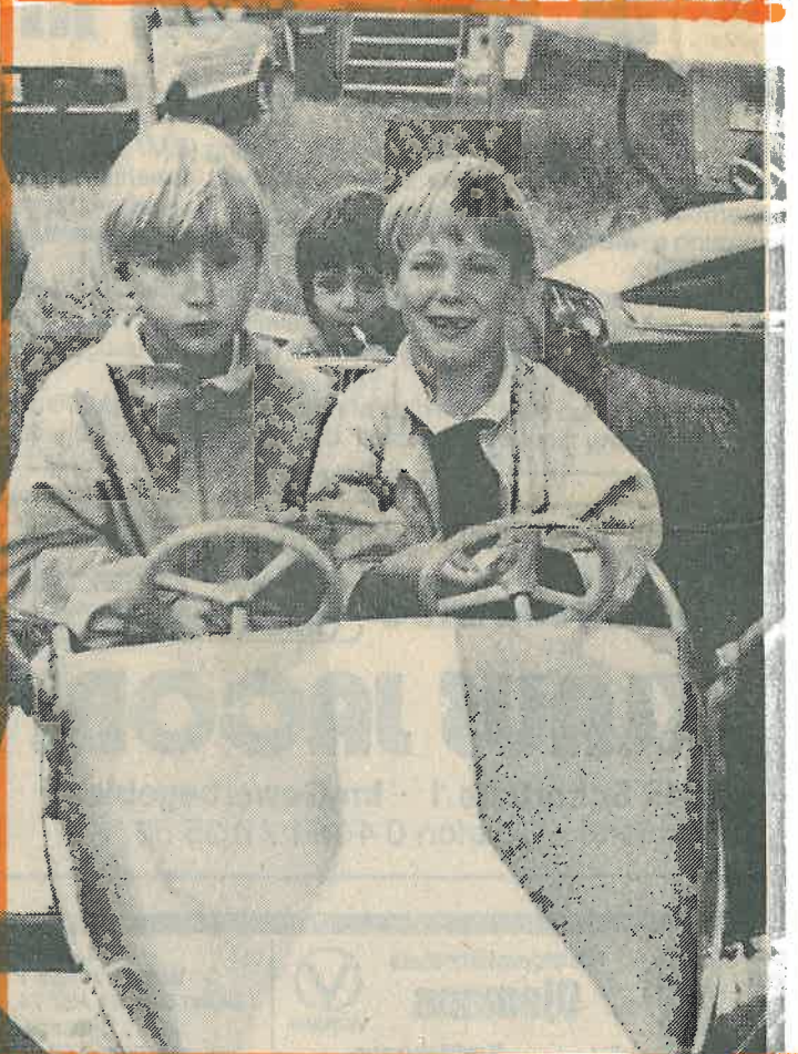
Nicht ganz geheuer kam es wohl bei dieser Raketenfahrt auf der grünen Wiese einigen der Passagiere vor.