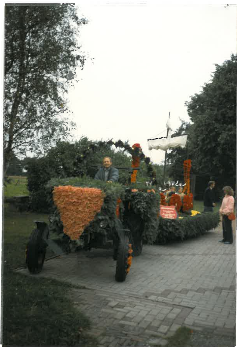
auf zum Umzug!