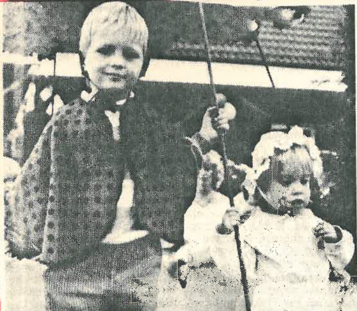
„Wir sind die Bienen und saugen den Nektar“.