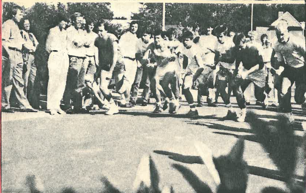
Ein spannender Wettkampf war wieder der traditionelle Staffellauf. Viele Grafschafter und Schortenser beteiligten sich daran.