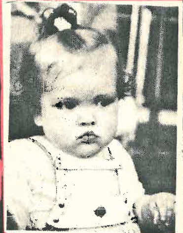
„Hoffentlich wählt man mich nicht zur neuen Grafschafter Brunnenkönigin“.