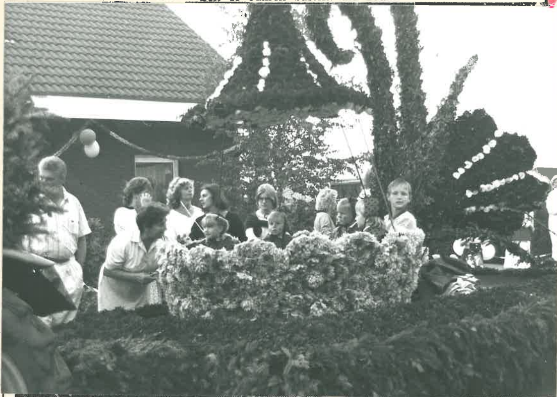
Die Grafschafter Püttnabers sind eine der Gemeinschaften, die jedes Jahr zum Brunnenfest in mühevoller Arbeit einen Korsowagen schmücken. Das leuchtende Prachtgefährt zuckelt während dreier Umzüge durch den Ort.