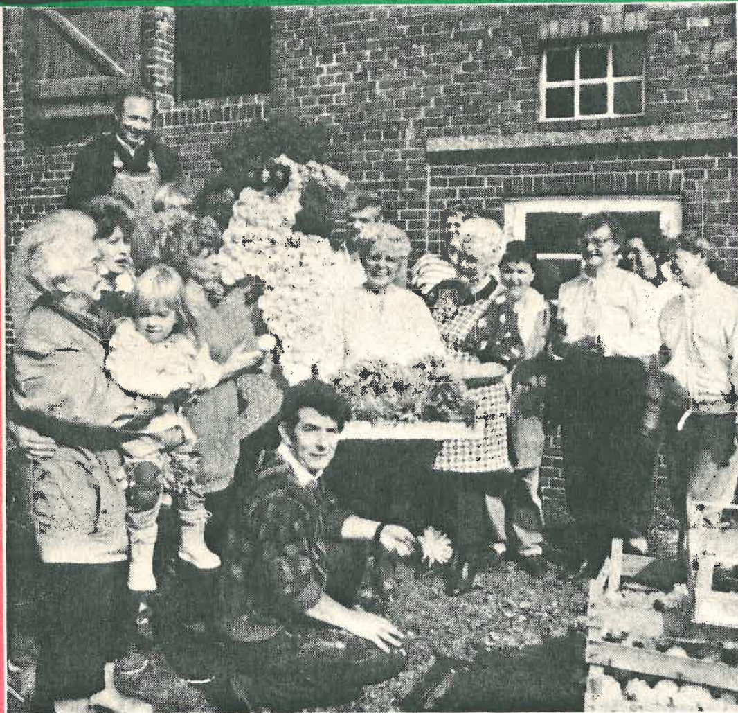
2000 Dalienköpfe pflückte eine Püttbacher-Gruppe gestern morgen in Grafschaft. Mit den bunten Blumen schmückte die Nachbarschaft ihren selbstgeschweißten Drahtwetterhahn.