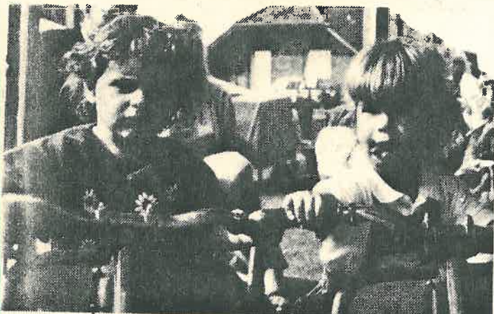
Für die Kinder wird auf dem Brunnenfest in Grafschaft viel geboten. Der Flohmarkt und das Kinderkarussell sind nur zwei der Attraktionen.

von den Fenstern den entsetzlichen Krach verursacht? Wer war der Rufer, der den Herrschaften das Gruseln beibrachte, daß der Lübbe Harken mit seinen Mannen im Anzug sei?