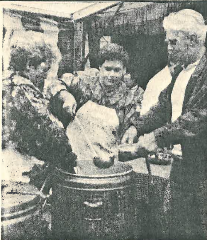
In umweltfreundliche Blechschalen schöpften die Helferinnen die leckere Erbsensuppe.