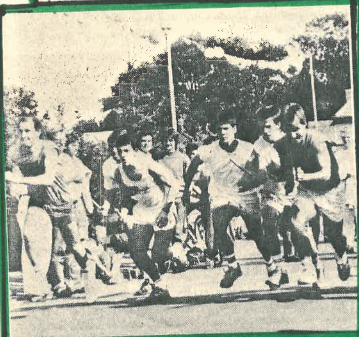
22 Mannschaften machten beim Staffellauf rund um Grafschaft am Sonnabendnachmittag mit. Unser Bild zeigt den Start zum Wettkampf der männlichen Senioren.