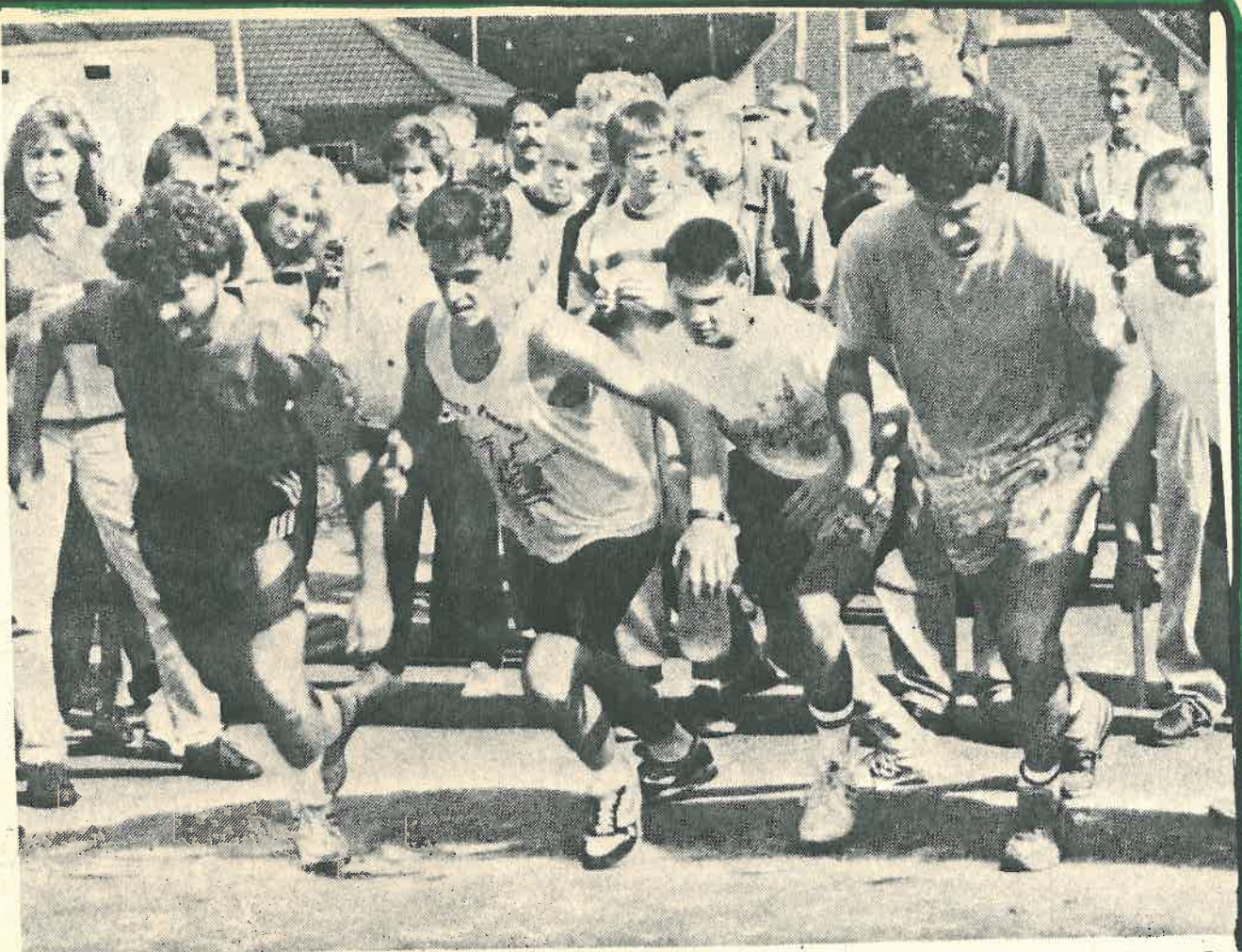
...Achtung...Fertig...Los...Beim Staffellauf rannte jung und alt um die Wette.