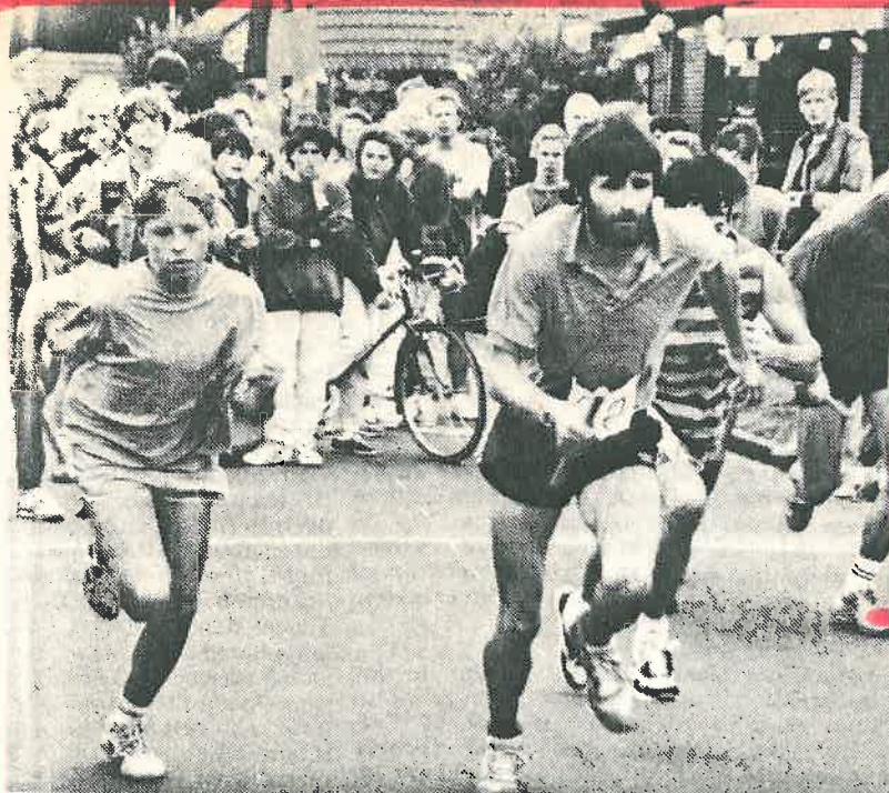
viel Begeisterung waren die Teilnehmer des Staffellaufes „Rund um Grafschaft“ bei der Sache. Unser Foto zeigt die Läufer in der Seniorenklasse (19 bis 39 Jahre) beim Start.