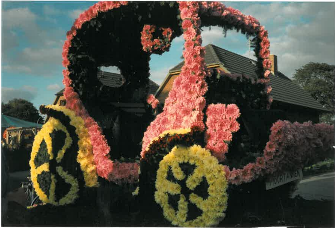
oben: Korsowagen der Moortanneu