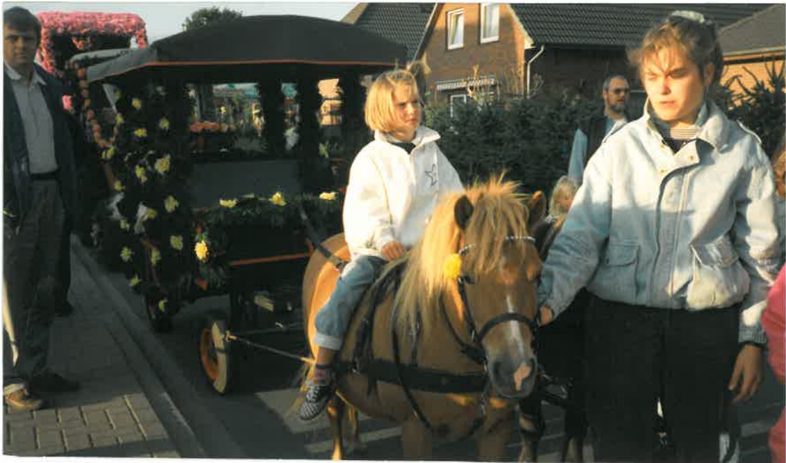
Prinzess- wagen Pony Gruppe