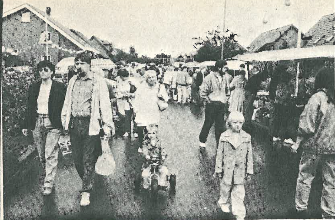
Ganz Grafschaft war am Wochenende beim Brunnenfest auf den Beinen. Der Flohmarkt als einer der vielen Höhepunkte erfreute sich regen Zuspruchs. Auch das zeitweilig drohende Regenwetter hielt die Bürger nicht von einem Besuch der Vergnügungsmeile ab.