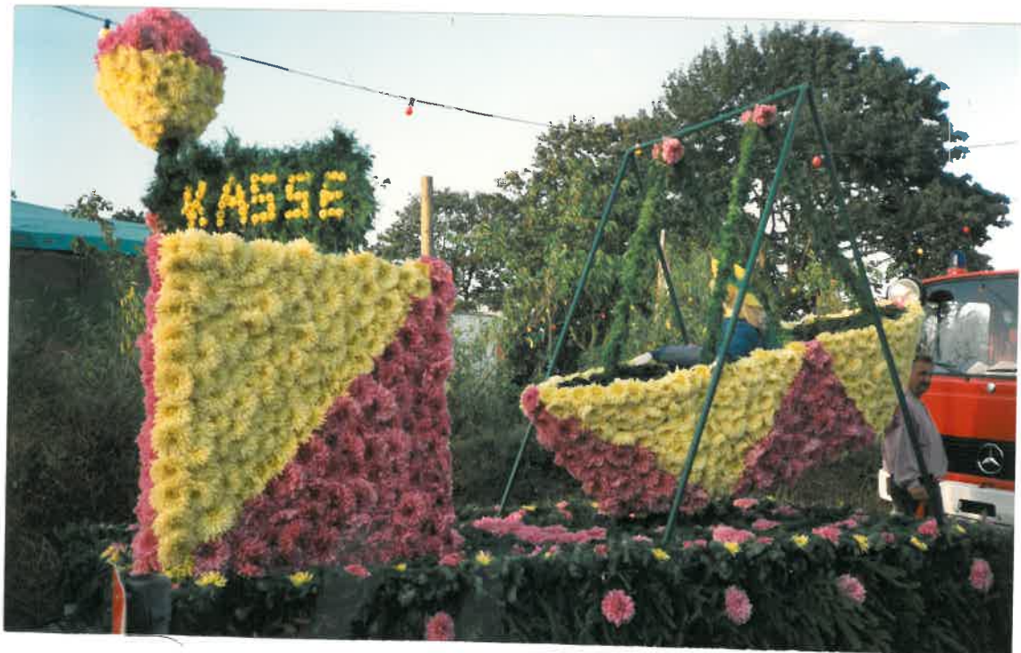
Sisi Horkowal Pony Gruppe