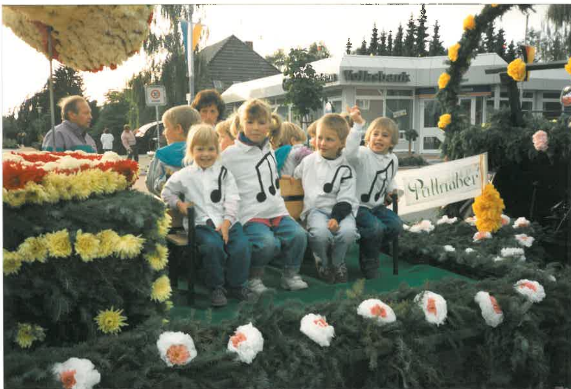
unten: Nachwuchs der Püttnerber