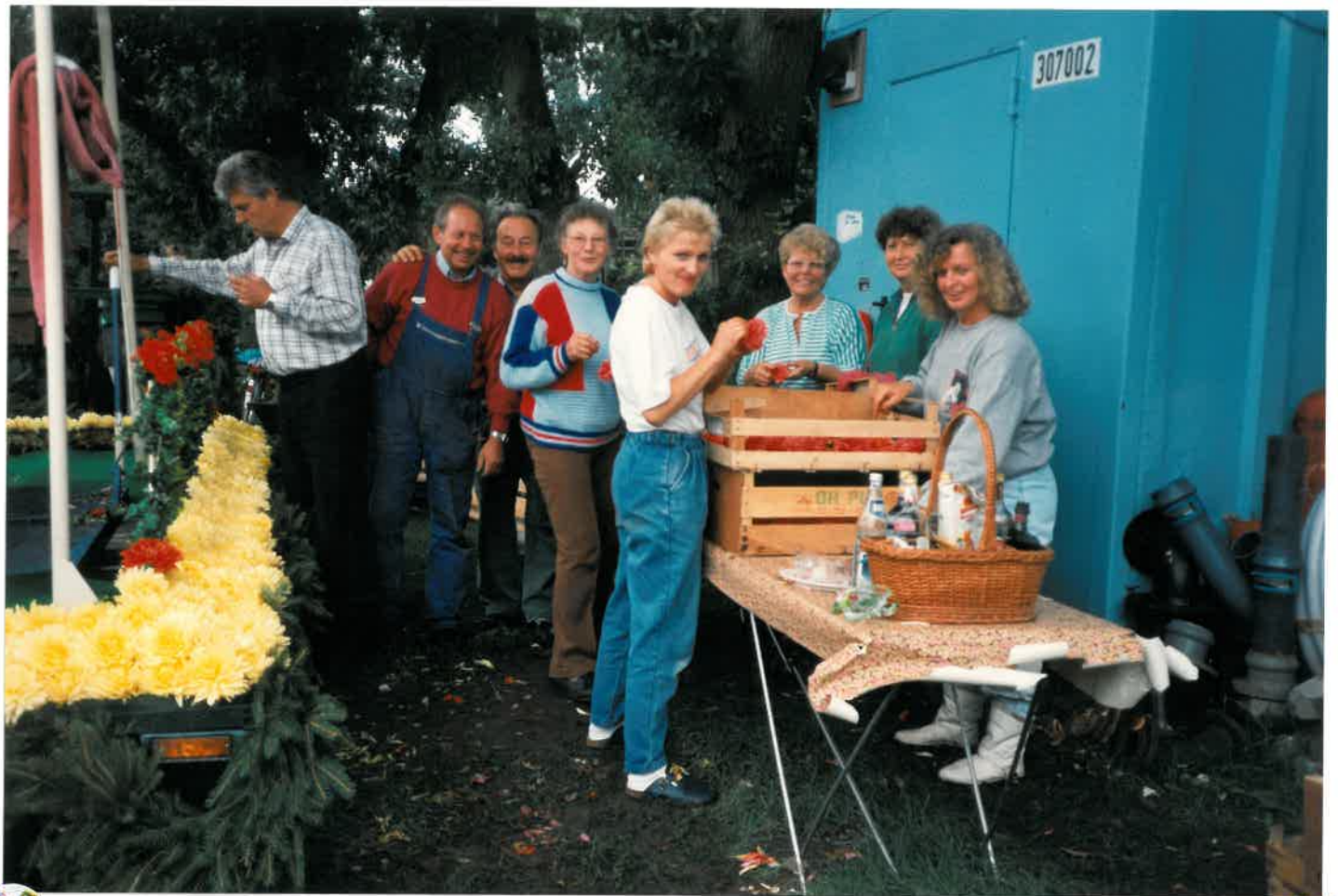
Die Korovagenbauer „Pütthaber“ : Gut Pütt!