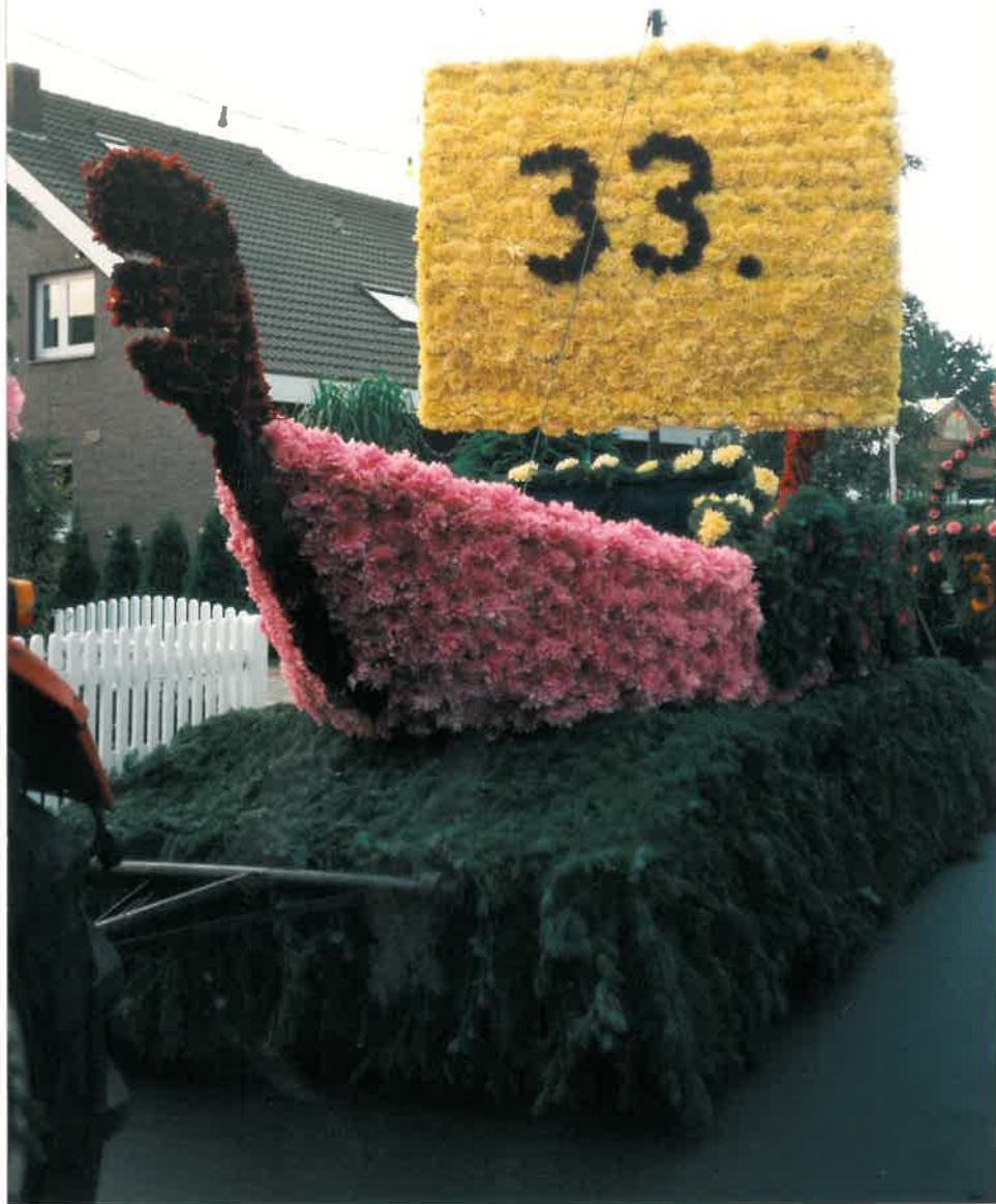
Die Wikinger-Kogge d. "Moortoumen"