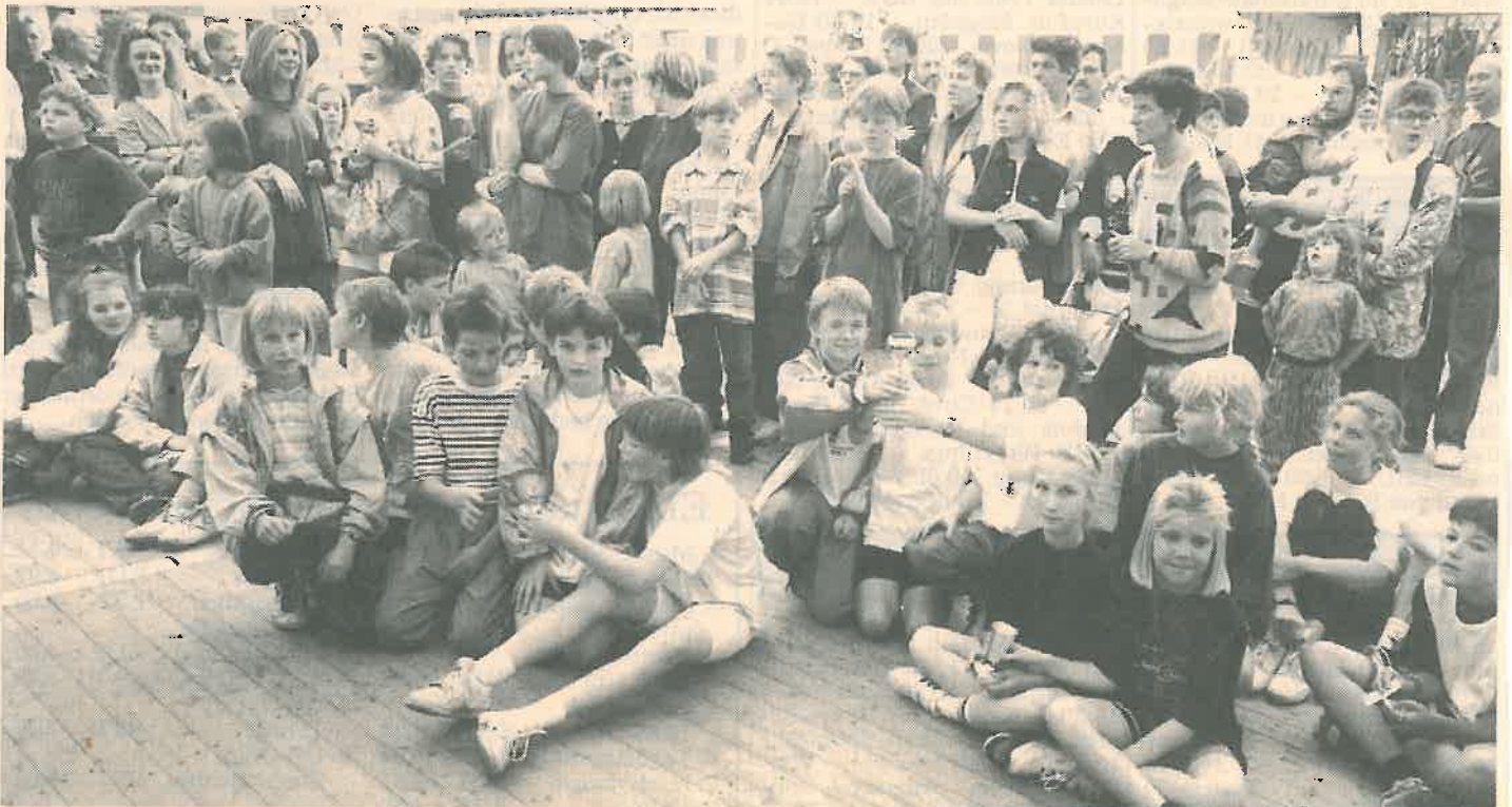
Bei der Preisverteilung nach dem Staffellauf: Glänzende Pokale und Lob gab es für alle 16 Teams, die diesmal dabei waren. Unser Bild zeigt einen Teil der Aktiven.

Gottesdienst, Frühschoppen, gemeinsames Mittagessen und dann der große Festumzug mit den prächtigen Korsowagen standen am Sonntag auf dem Programm. Ein Kindertanz und schließlich der Ausklang beendeten das rundherum gelungene 33. Grafschafter Brunnenfest.