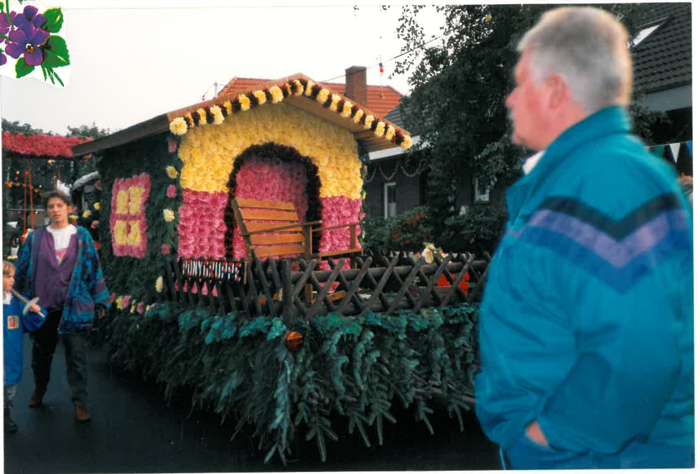
Korsovagenbauer „Pony-Gruppe“: Gartenbauclub