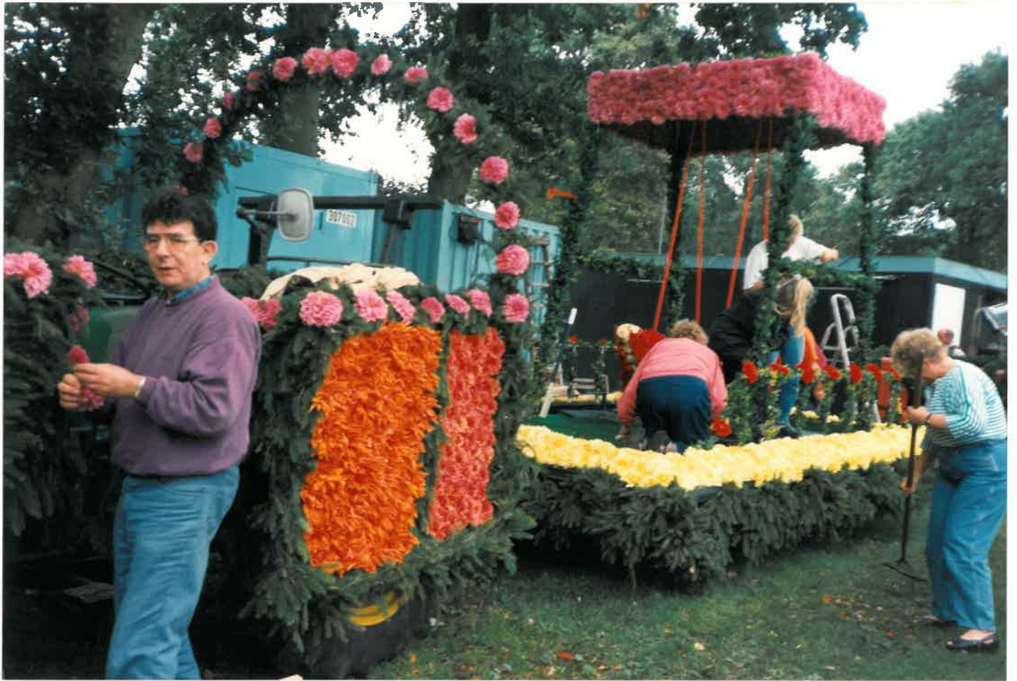
Oben: Der letzte Schliff